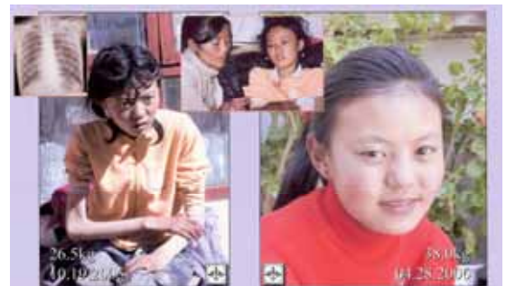
Hospitalisées 7 semaines, cette jeune tibétaine de 14 ans et sa mère ont retrouvé leurs forces et sont sous traitement dans une maison de repos